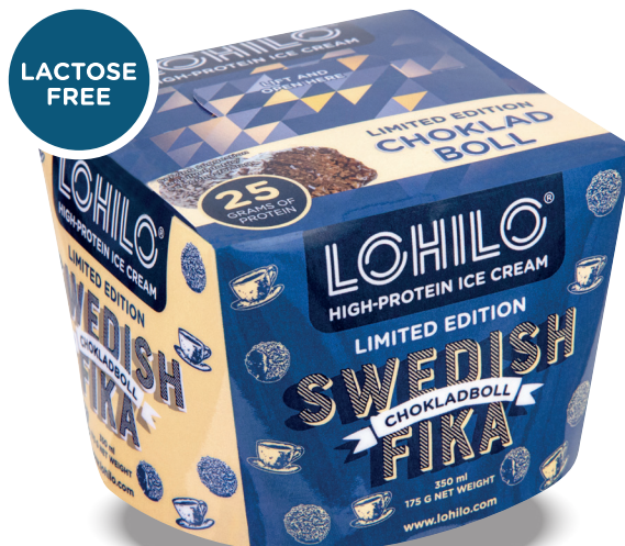
Produktnyheter LOHILO hösten 2018, Raspberry Salty Licorice och Swedish Fika.